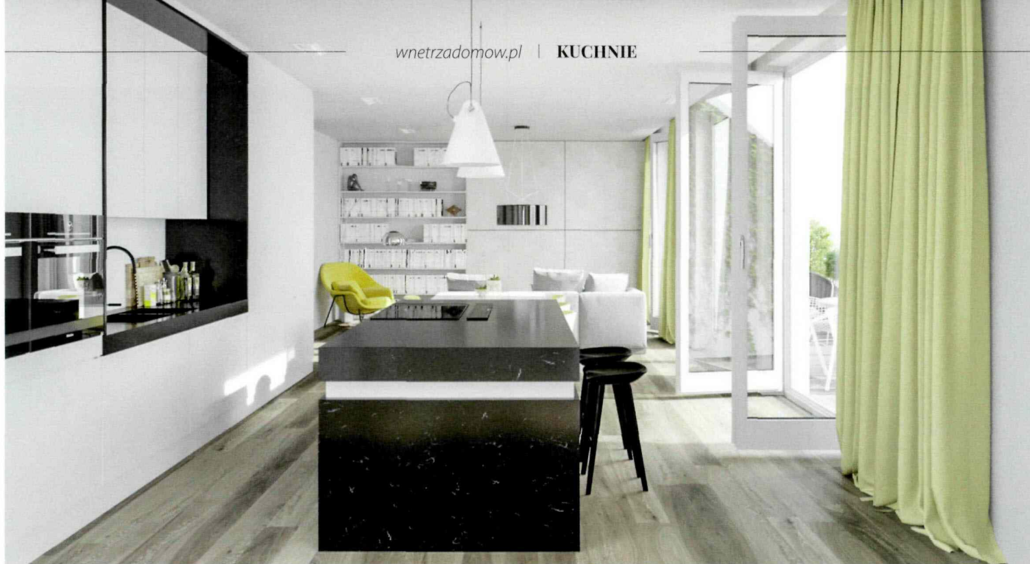
BRILLIANT GALAXY Wyspa kuchenna z konglomeratu kwarcytowego marki TechniStone® w kolorze Brilliant Galaxy idealnie komponuje się z jasnym wnętrzem. TECHNISTONE, www.technistone.com

Wyspa kuchenna jest bardzo popularnym rozwiązaniem. To prawdziwy kombajn funkcji, do którego mamy wygodny dostęp z każdej strony. Jednak by cieszyć się w pełni z tego przydatnego mebla, warto zwrócić uwagę na kilka istotnych kwestii.