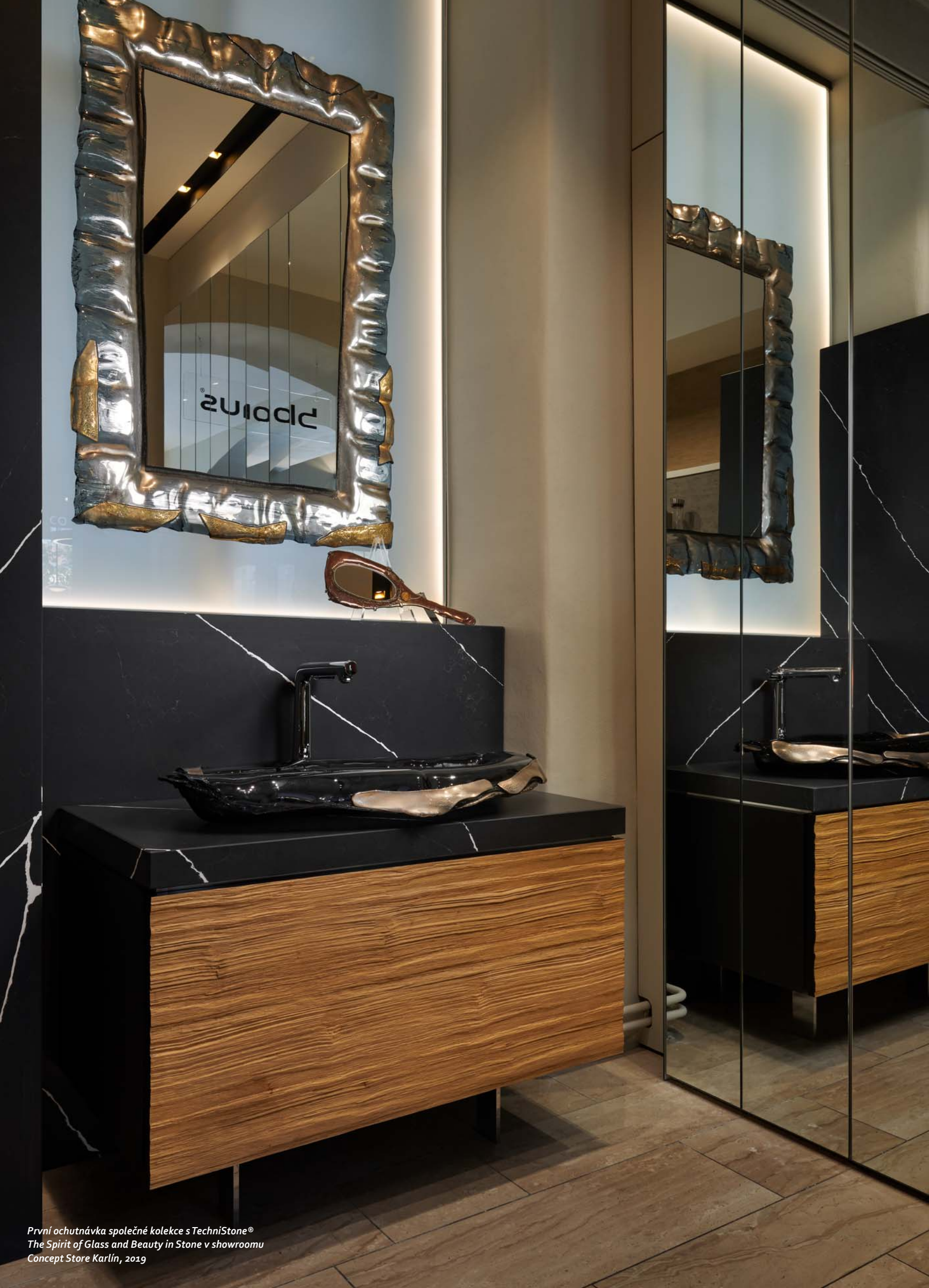
První ochutnávka společné kolekce s TechniStone® The Spirit of Glass and Beauty in Stone v showroomu Concept Store Karlín, 2019

pořádání rozsáhlejších eventů. Celá rekonstrukce bude pokřtěna na jaře roku 2020 prezentací nové kolekce The Spirit of Glass & Beauty in Stone s TechniStone® a křtem právě rozpracované publikace – novým katalogem.