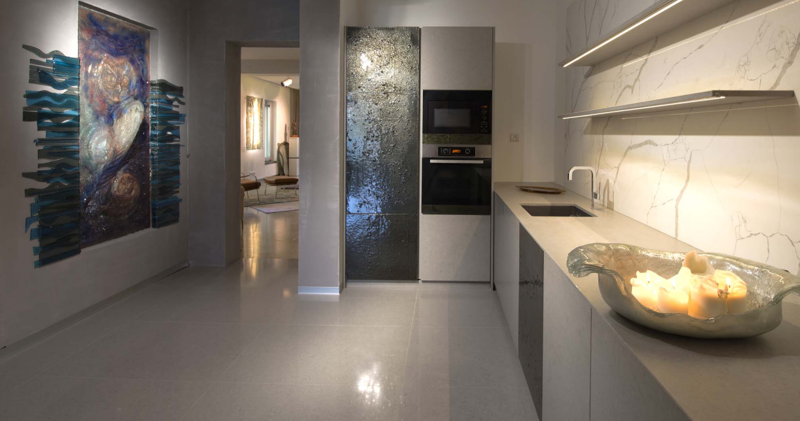
Společná kolekce s TechniStone® The Spirit of Glass & Beauty in Stone v kuchyňském provedení, 2019