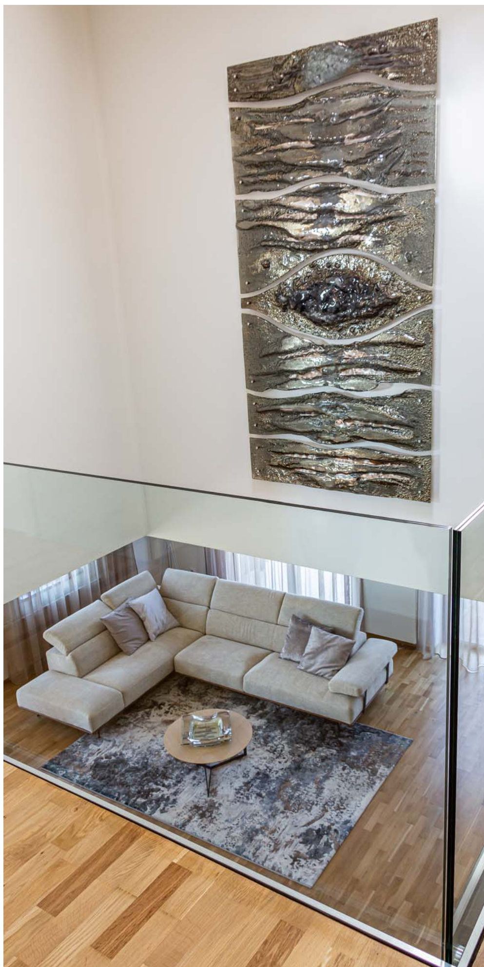
Soukromý interiér, Praha, 2019